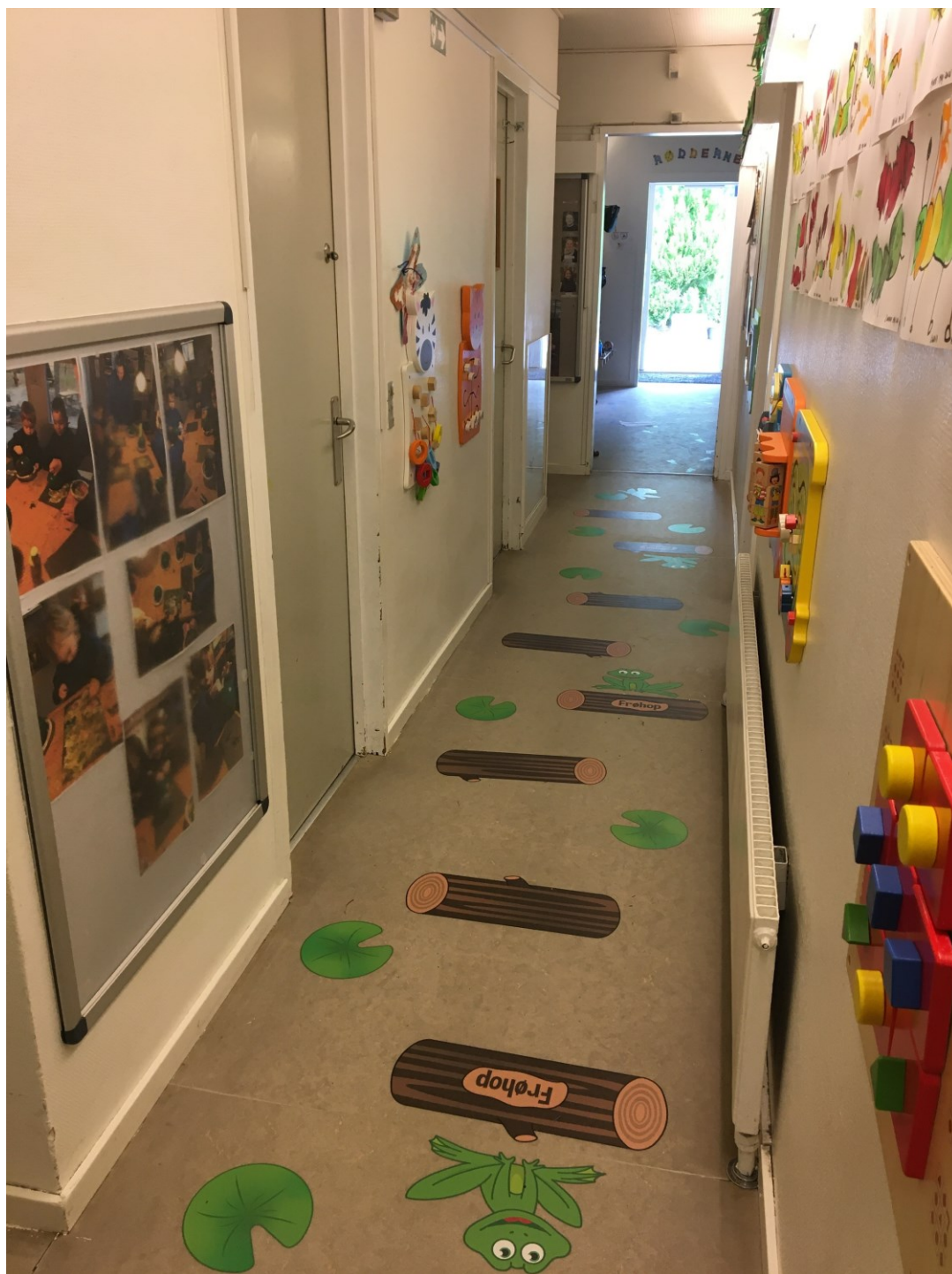
Gangarealet der er blevet ændret efter begrebet affordance.